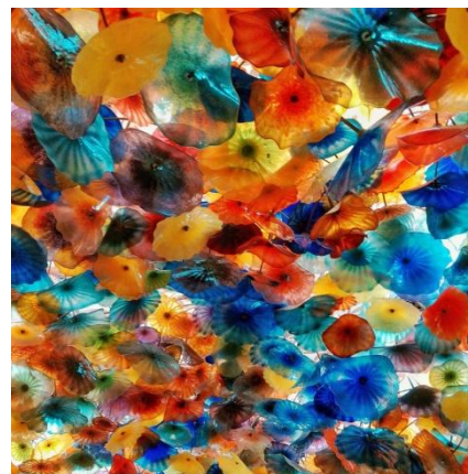
Plafond du Cesar Palace, Las Vegas

Si toi aussi, tu veux partager tes œuvres, écris au journal : mdlhautil@gmail.com