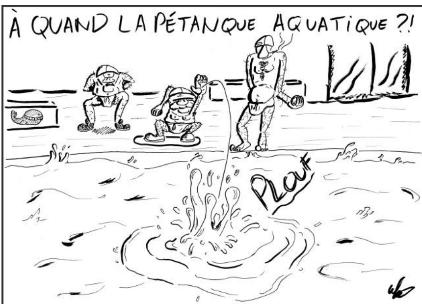
Dessin : Ulysse H.