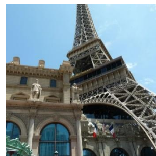
Las Vegas, juillet 2018