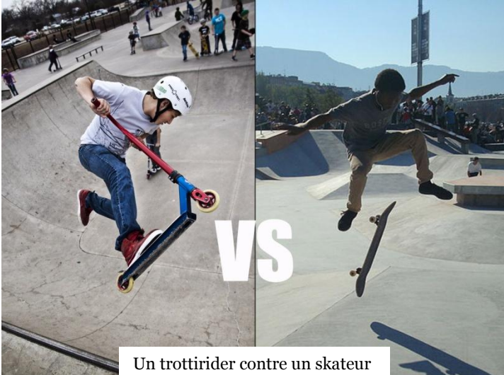
Un trottirider contre un skateur