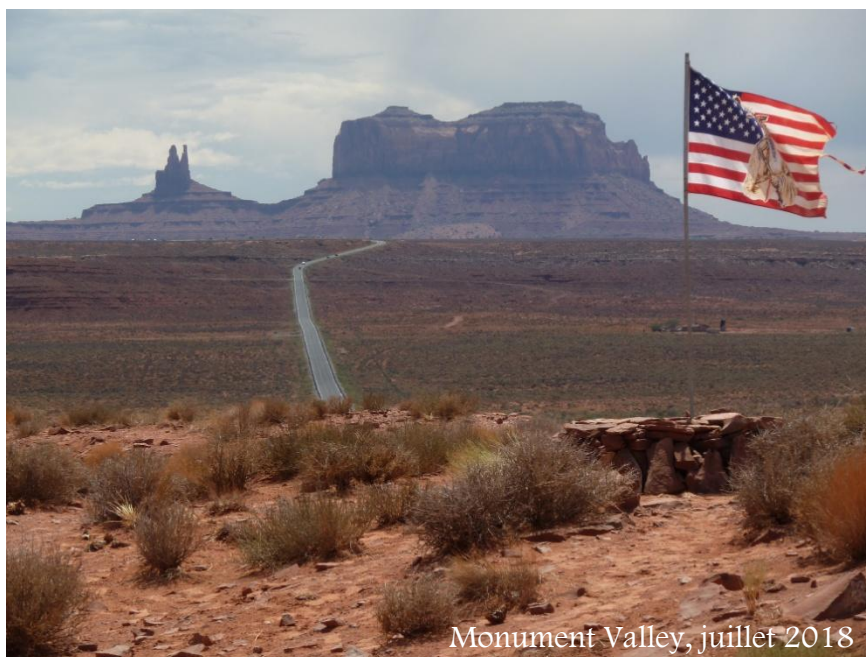
Monument Valley, juillet 2018