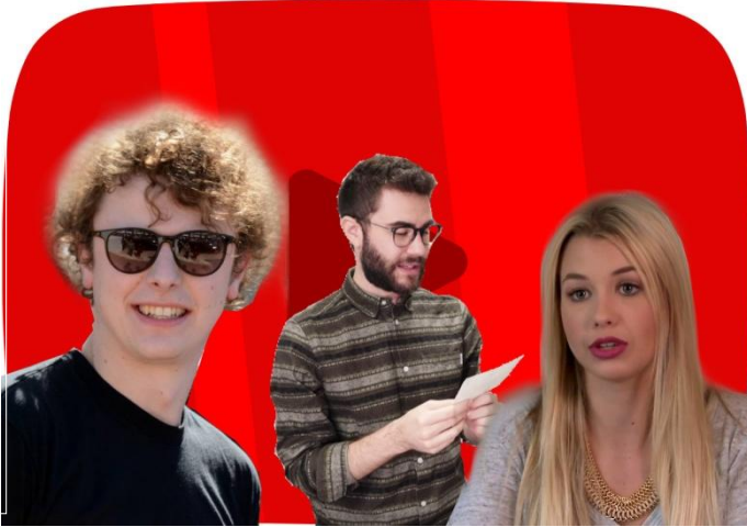
Trois youtubeurs français devenus célèbres : Norman, Cyprien et Marie, alias EnjoyPhoenix

Montage à partir d'images libres de Wikiaédia