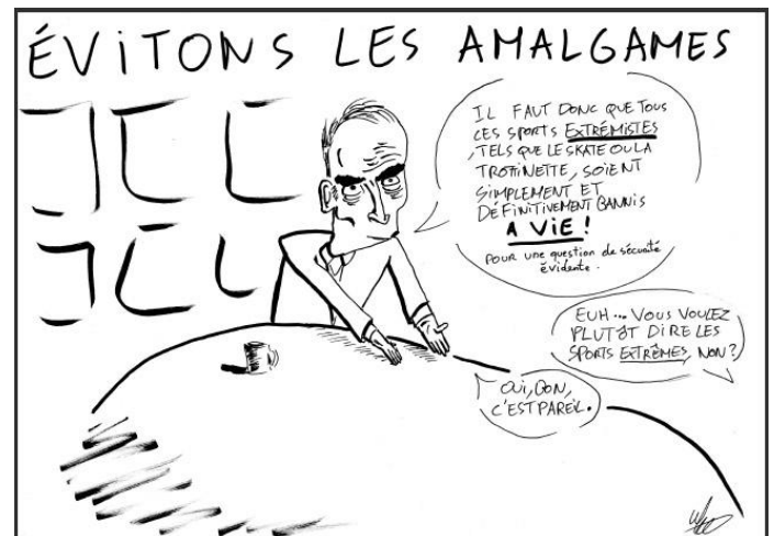
Dessin : Ulysse H.