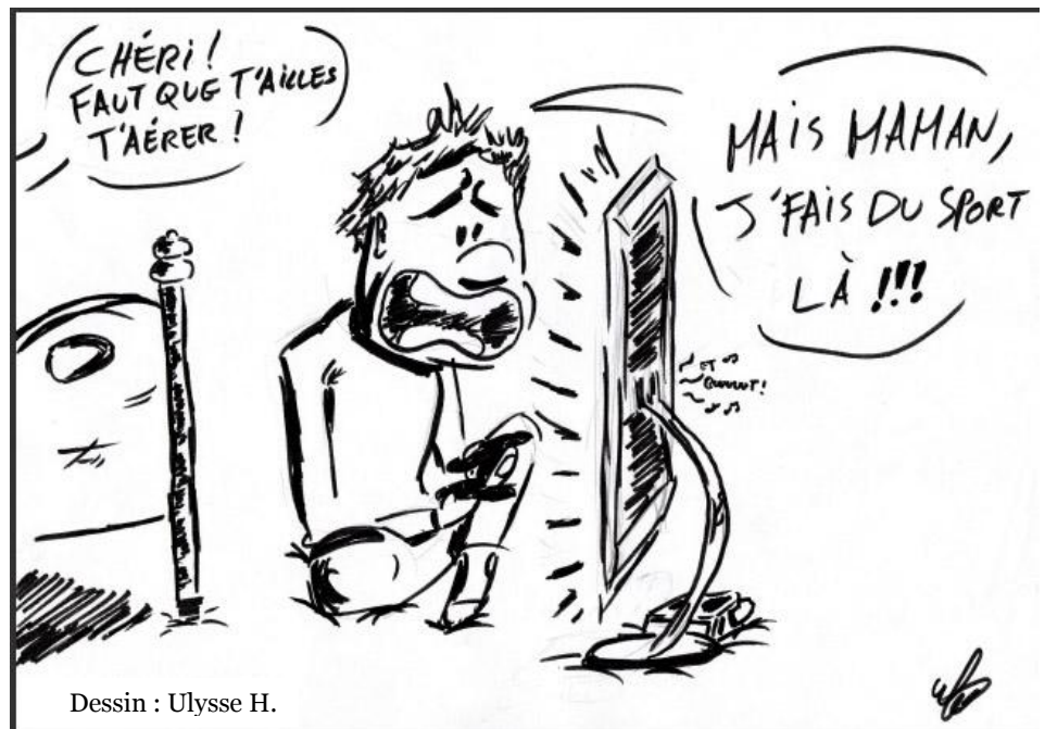
Dessin : Ulysse H.