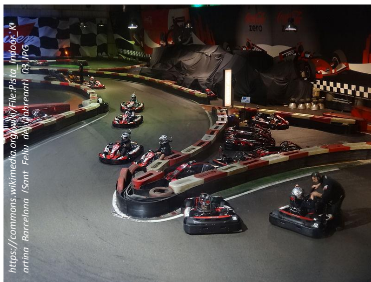
Du karting en intérieur

Venez vite vous inscrire le nombre de places est limité !